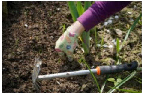
Selbst gezogenes Gemüse zeigt uns den Wert der Lebensmittel.