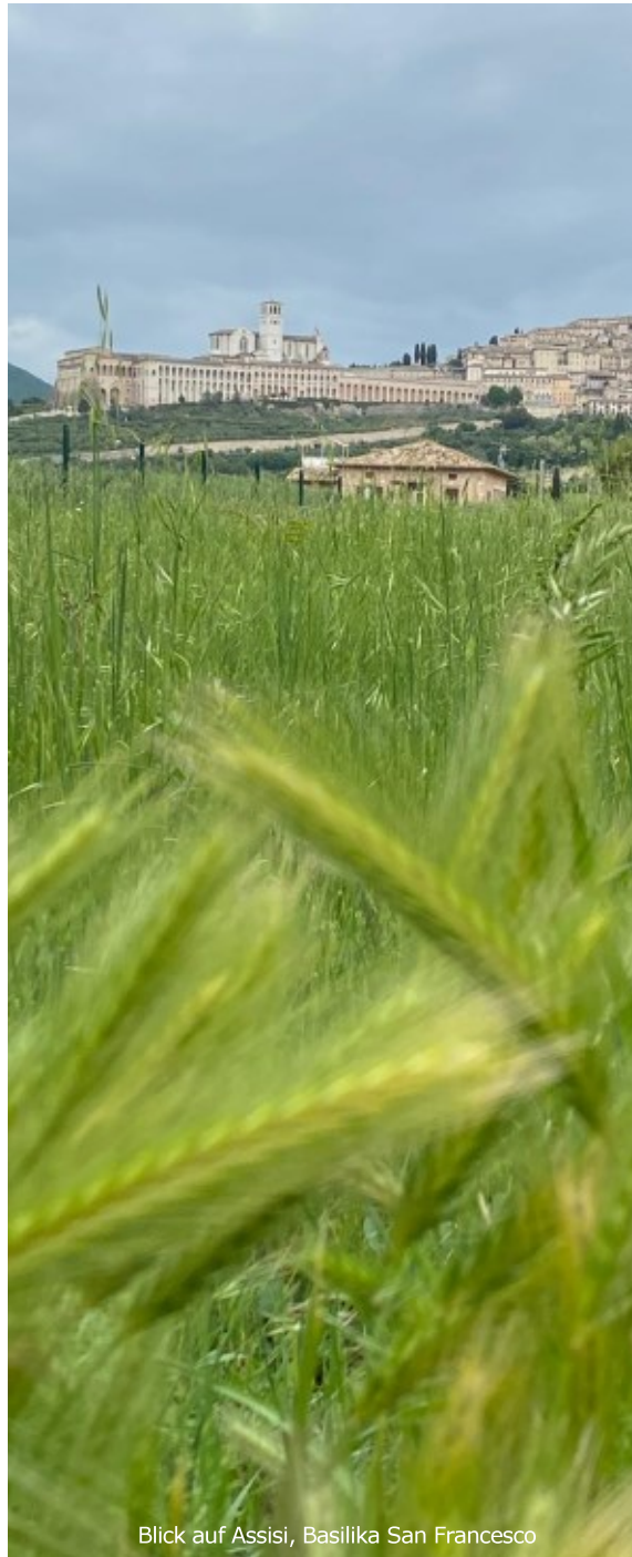
Blick auf Assisi, Basilika San Francesco

Eine Fortsetzung folgt im nächsten Pfarrblatt