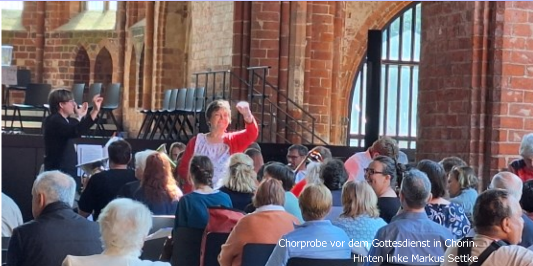
Chorprobe vor dem Gottesdienst in Chorin.