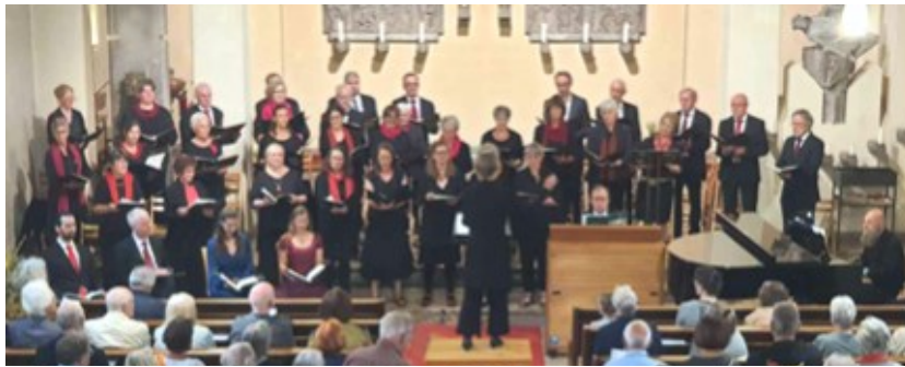
Sogar ein Flügel und ein Harmonium haben die Sänger

Besonders der letzte Satz, das atembere-