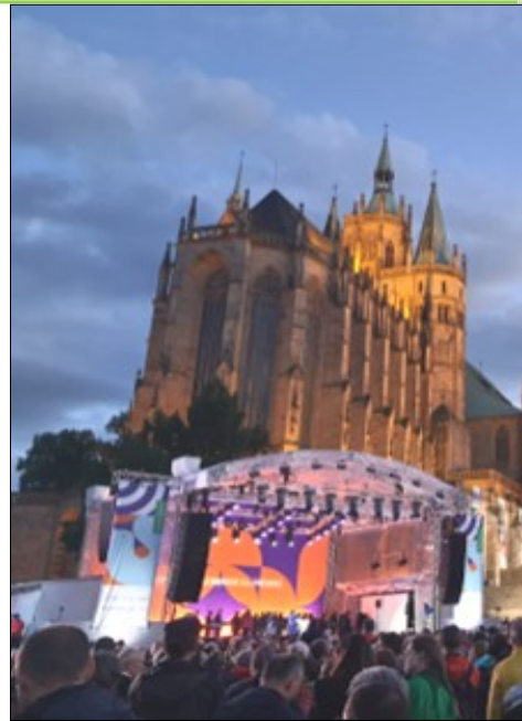
Beeindruckende Stimmung beim

Erfurt ist eine wunderschöne Stadt mit kurzen Wegen zu den vielen Kirchen und Veranstaltungsorten. Es gab ein umfangreiches Programmangebot, in dem für jeden passende Angebote dabei waren. Die Auswahl fiel nicht leicht.