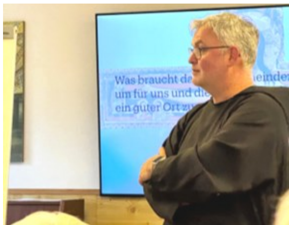
Lektor des Workshops Br. Bernd

Angeregt wurde zur Diskussion hinsichtlich des geplanten Neubaus, Gemeindezentrum und Außenanlagen. Es wurden Ideen, Wünsche und Vorschläge für Raum- und Platzbedarf zusammengetragen und mit Blick auf den Aspekt Nachhaltigkeit gewertet. Fazit: nicht alles ist umsetzbar, es werden unerfüllte Wünsche bleiben oder auch unbezahlbare.