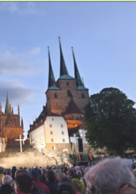
Eröffnungsgottesdienst auf dem Domplatz

Der Schwerpunkt muss immer noch auf der Vermeidung der Ursachen liegen, die Kosten dafür sind erheblich geringer als die ungeheuren Kosten für die zu erwartenden Folgeschäden.