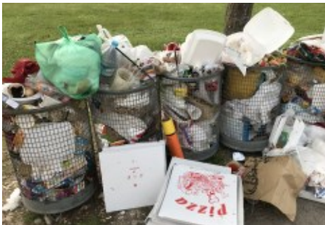
Mit unserem Müll belasten wir die Erde.

Was hat das nun mit Umweltschutz zu tun? Überlege einmal: Wir holen von unserer Erde Jahr für Jahr mehr Rohstoffe, als nachwachsen können. Pflanzen und Tiere sterben aus. Trinkwasser wird knapp und fruchtbare Flächen werden kleiner. Würdest du das bei deinem Wald machen, so würden am Ende alle Bäume weg sein und es