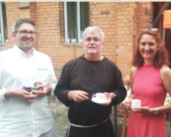
Text und Fotos: Pfarrblatteam Mehr dazu auf unserer Webseite