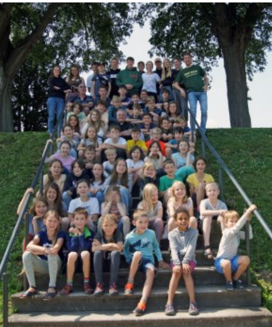
Gruppenfoto auf der Treppe